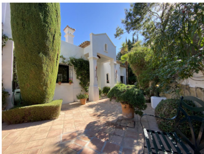
Jardin delantero tipo morsico