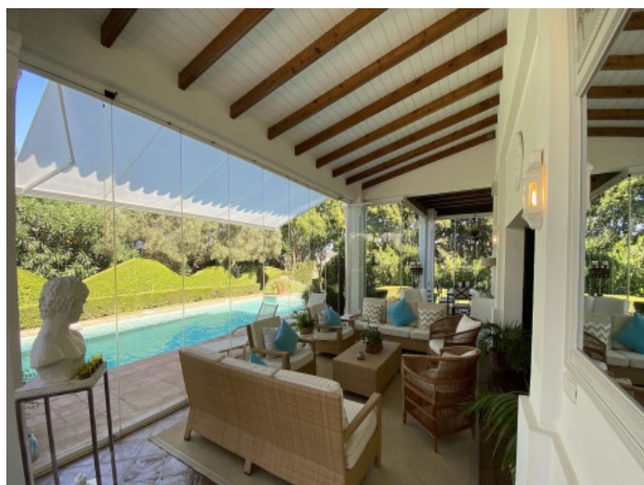
Terraza grande von vistas a la piscina