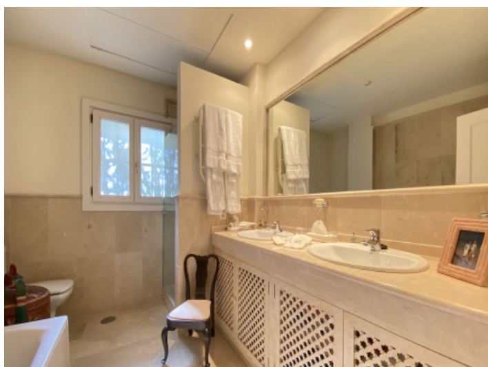
Baño con ducha y bañera