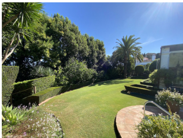
Jardin en condiciones impecables