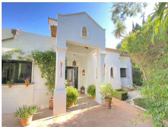
Entrada a la villa