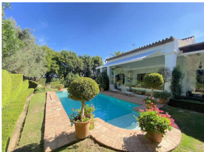
Vistas a la villa