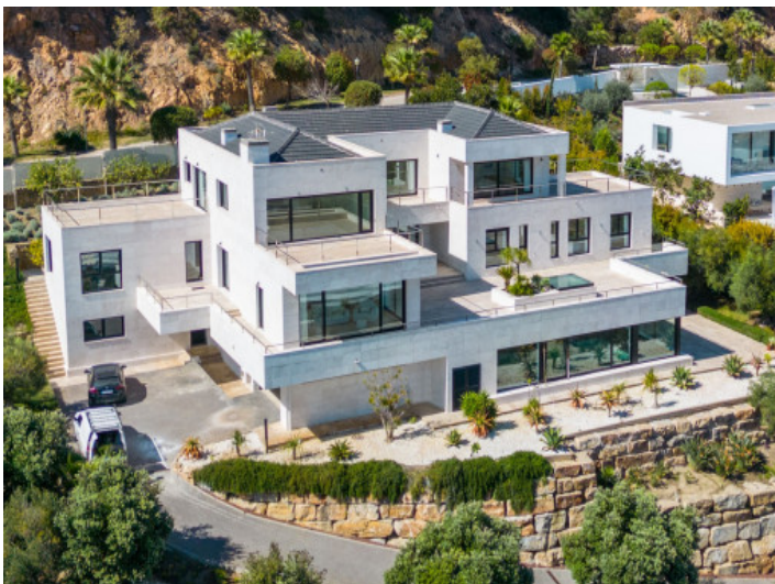
Vista desde arriba

Toda la información como mejor se puede saber, salvo por error durante el periodo de venta. Sirva este documento como un informe previo, las bases legales solo serán válidas a través de un contrato de compra acordado ante Notario.