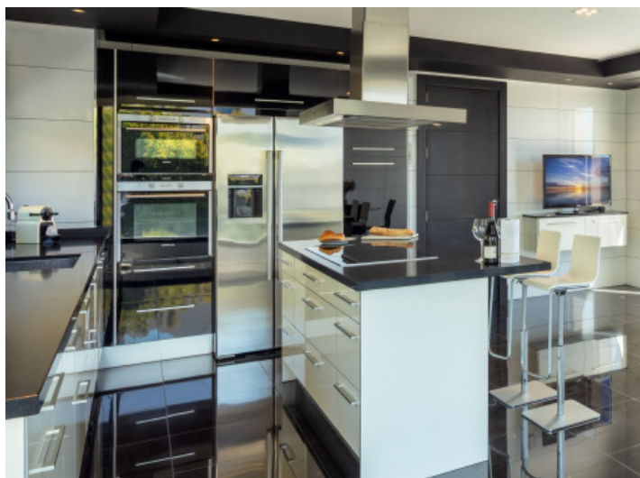
Cocina de lujo