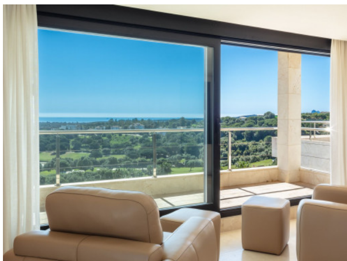
Salón con vistas panorámicas