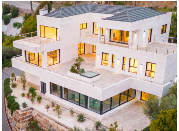
Chalet de estilo moderno