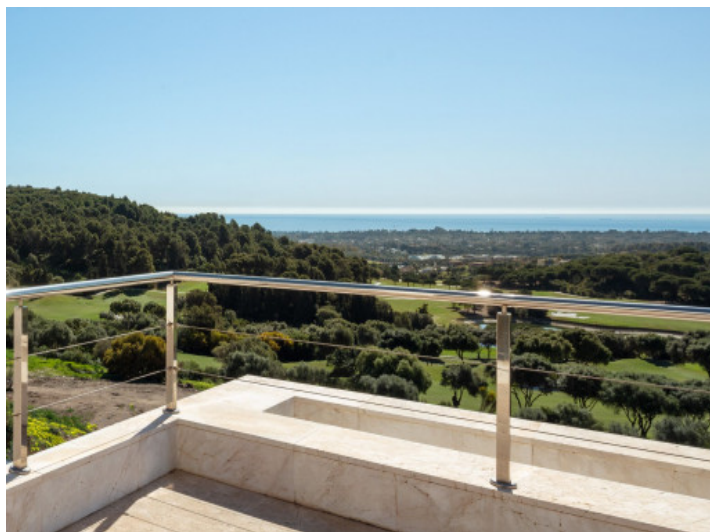
Terraza con vistas estupendas