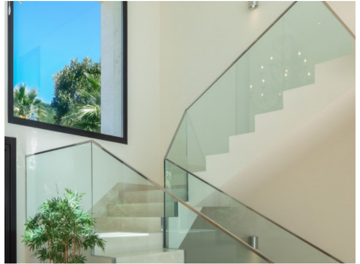
Escalera con barandilla de cristal