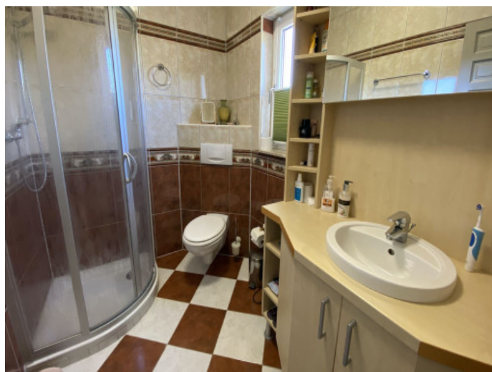
Uno de 5 baños