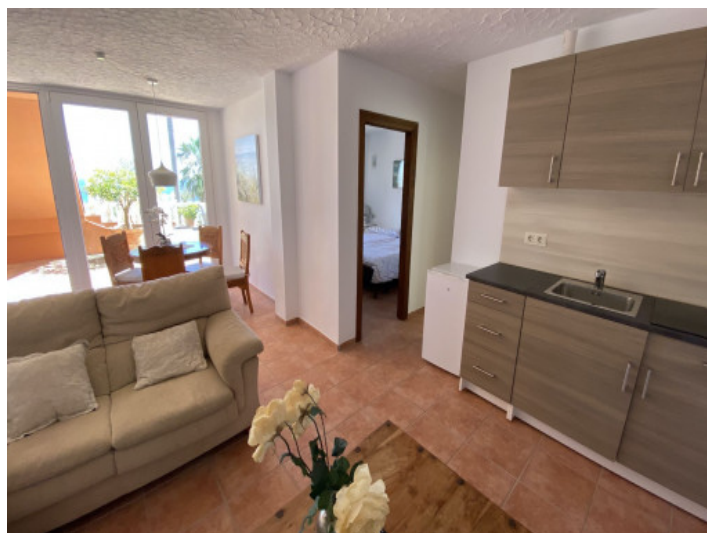
Salón-comedor con cocineta

Toda la información como mejor se puede saber, salvo por error durante el periodo de venta. Sirva este documento como un informe previo, las bases legales solo serán válidas a través de un contrato de compra acordado ante Notario.