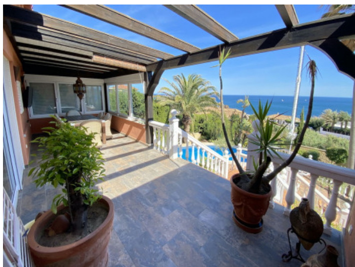
Terraza parcialmente cubierta