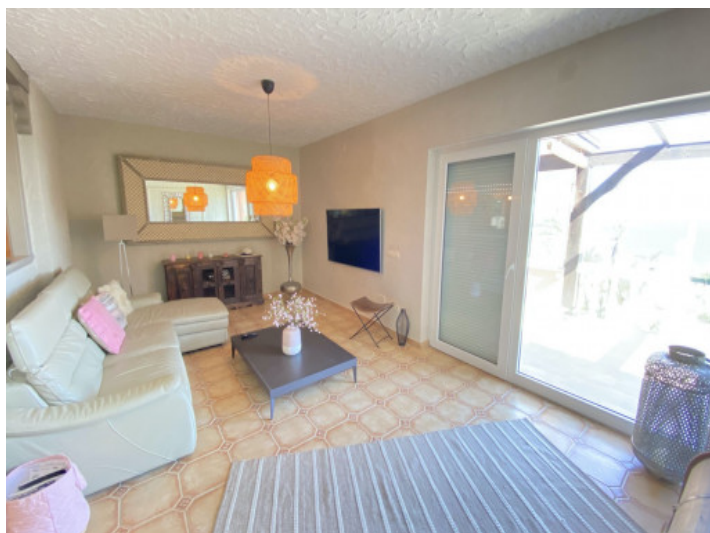
Salón con salida a una terraza