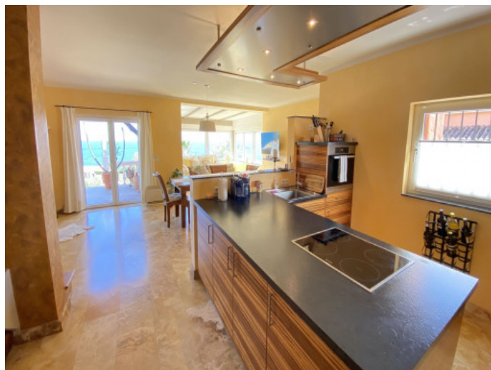
Cocina completamente equipada