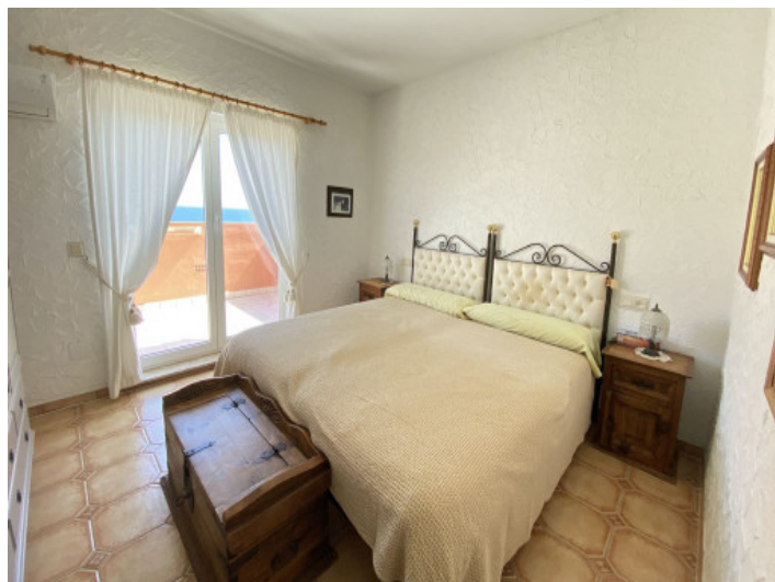
Uno de 4 dormitorios