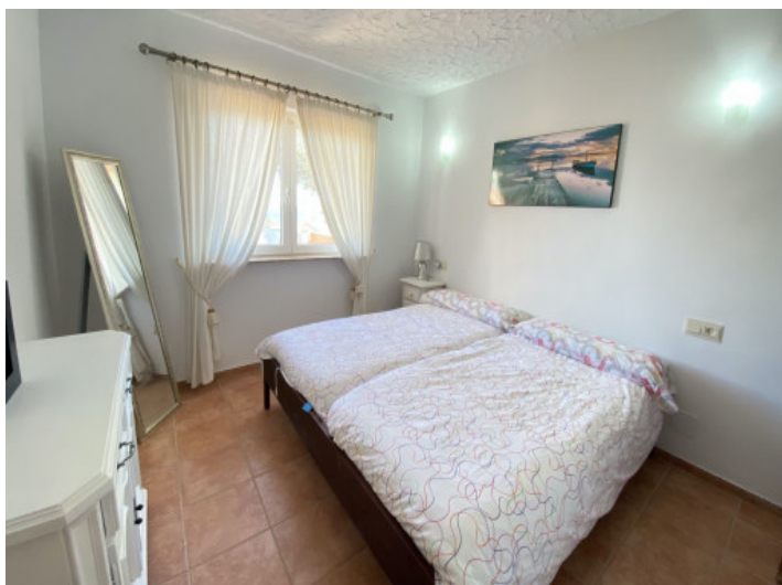
Uno de 4 dormitorios