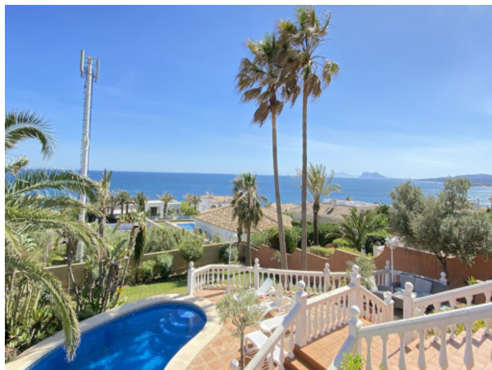
Bonita zona de piscina