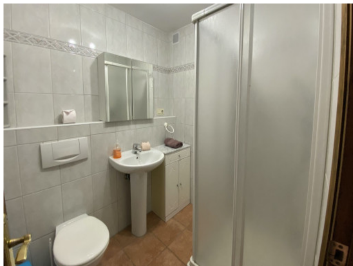
Uno de 5 baños