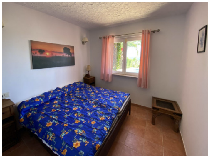
Uno de 4 dormitorios