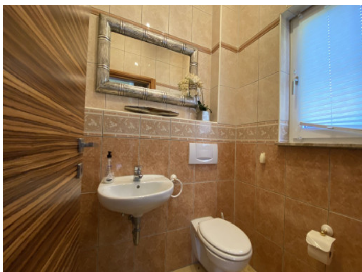
Uno de 5 baños