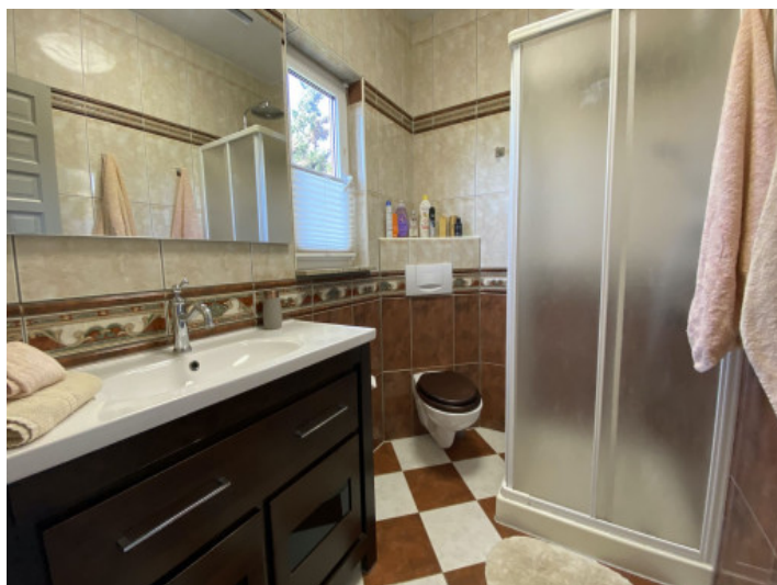
Uno de 5 baños