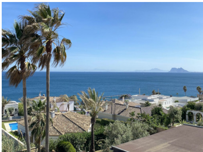
Fantásticas vistas al mar