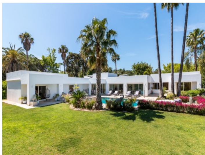
Jardín bien cuidada