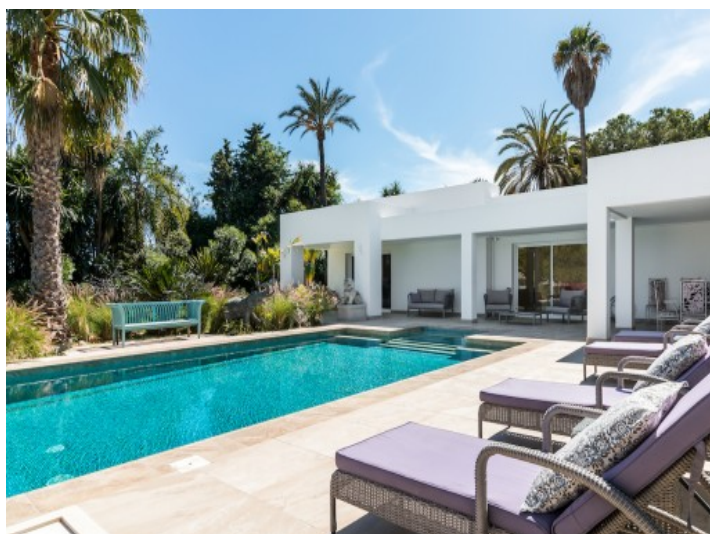
Área de piscina con hamacas cómodas