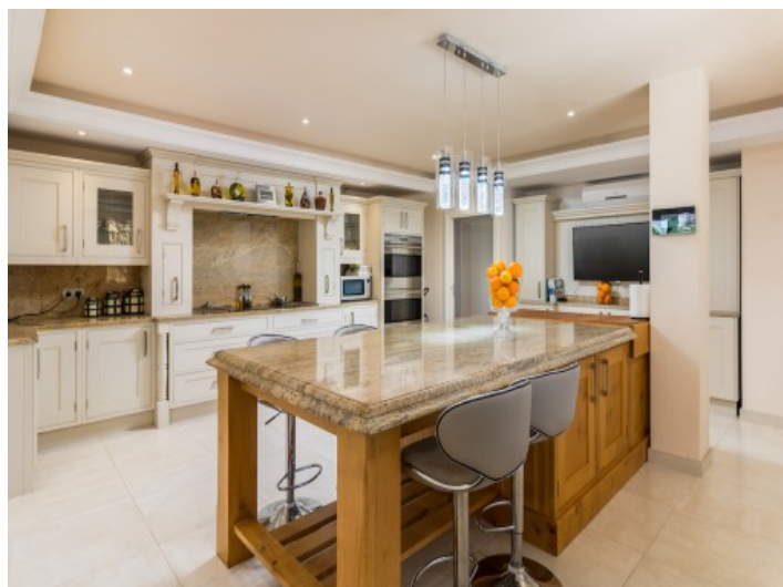
Gran cocina totalmente equipada

Toda la información como mejor se puede saber, salvo por error durante el periodo de venta. Sirva este documento como un informe previo, las bases legales solo serán válidas a través de un contrato de compra acordado ante Notario.