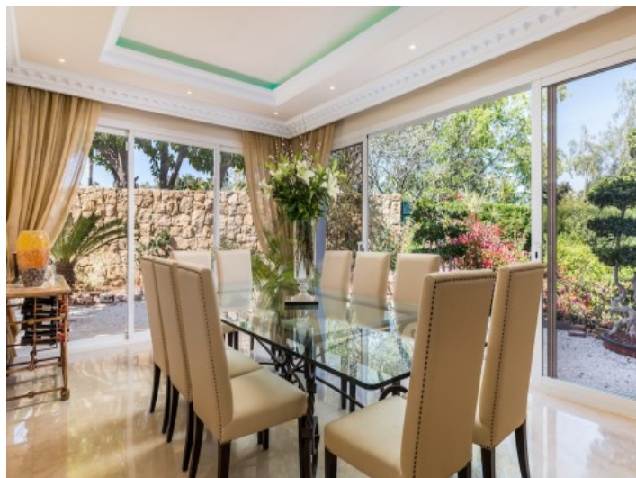
Comedor con ventanas panorámicas