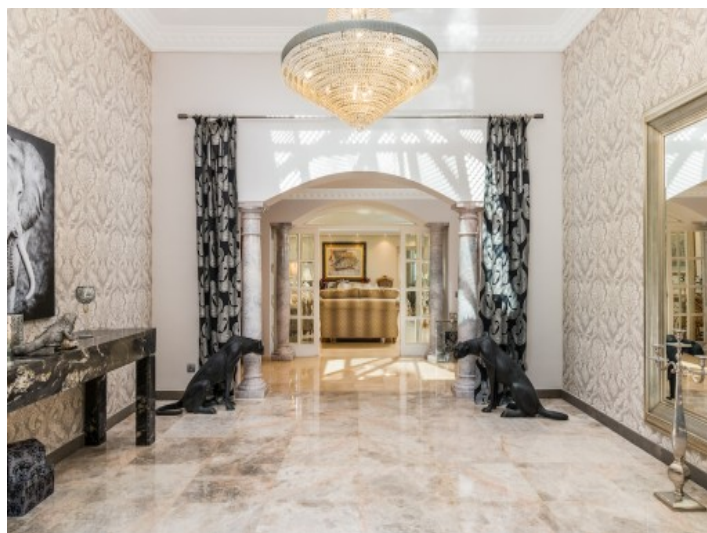
Área de entrada única

Toda la información como mejor se puede saber, salvo por error durante el periodo de venta. Sirva este documento como un informe previo, las bases legales solo serán válidas a través de un contrato de compra acordado ante Notario.