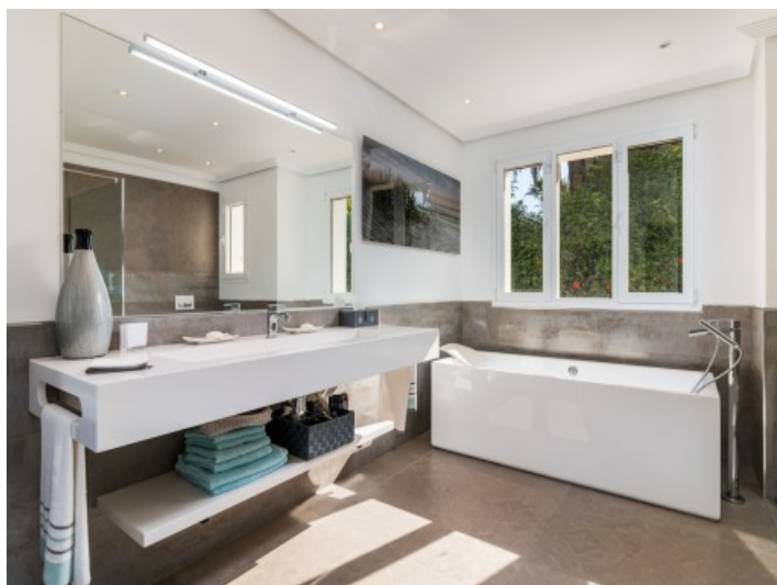
Uno de 4 baños