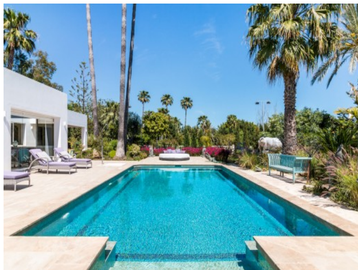
Villa magnífica con gran jardín en Estepona