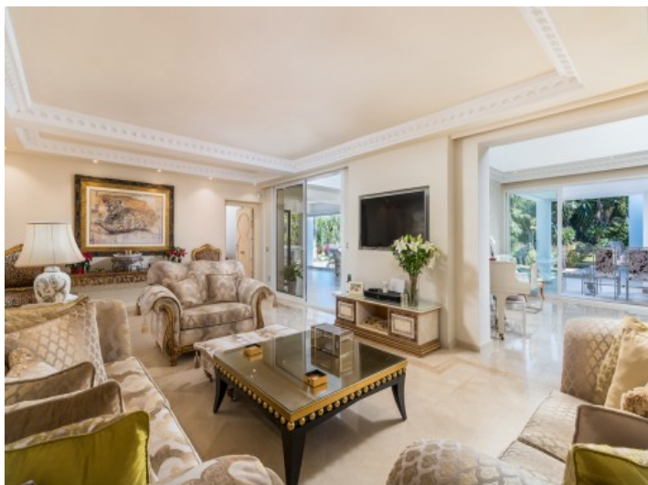
Amplia área de estar