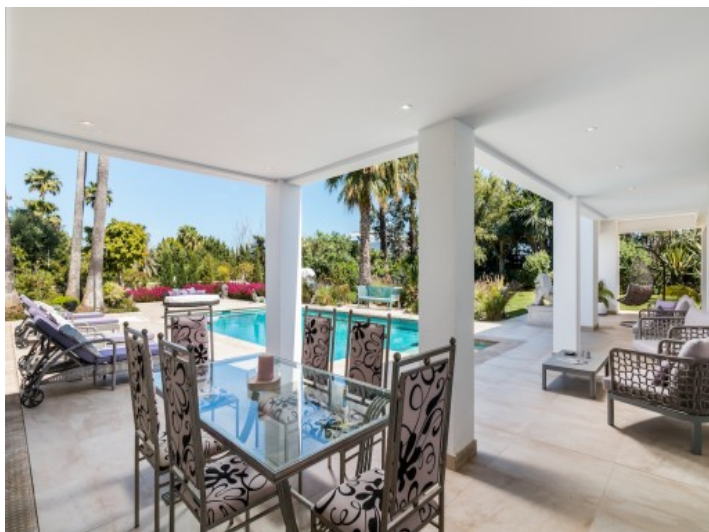
Encantadora terraza con comedor