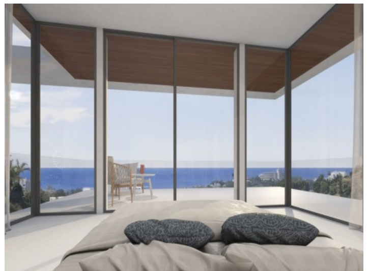
Uno de 4 dormitorios