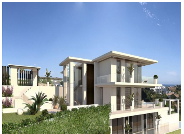
Vista exterior del edificio

Toda la información como mejor se puede saber, salvo por error durante el periodo de venta. Sirva este documento como un informe previo, las bases legales solo serán válidas a través de un contrato de compra acordado ante Notario.