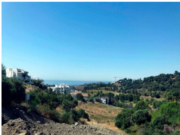
Paisaje circundante con vistas excelentes