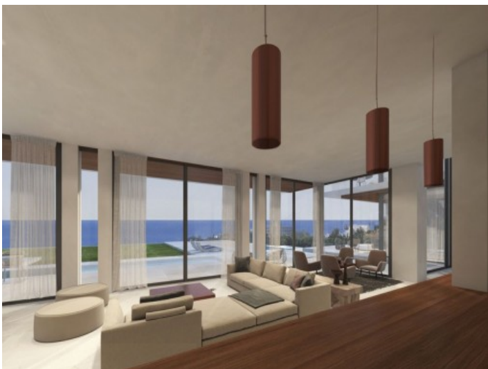
Sala de estar muy luminosa con vistas abiertas