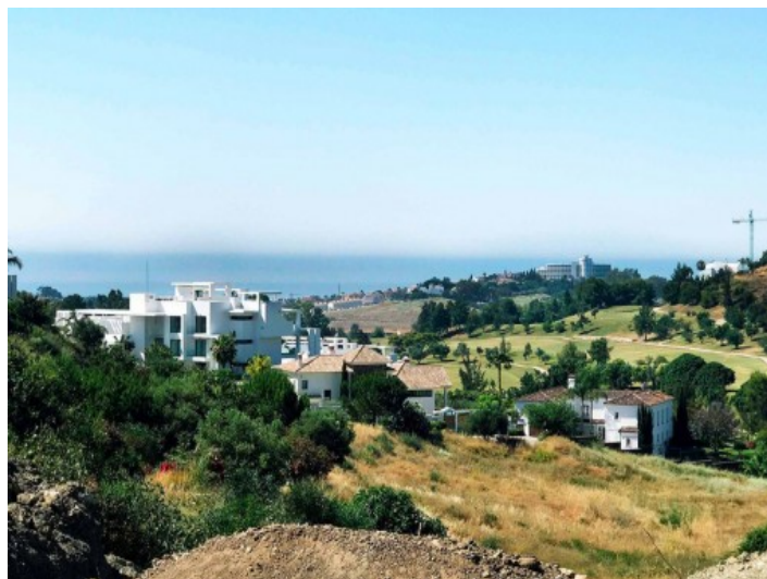
Vista alternativa del paisaje

Toda la información como mejor se puede saber, salvo por error durante el periodo de venta. Sirva este documento como un informe previo, las bases legales solo serán válidas a través de un contrato de compra acordado ante Notario.