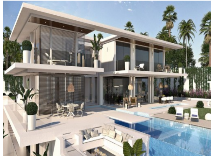
Vista alternativa de la zona exterior con piscina infinita