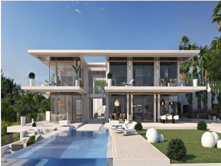
Vista frontal de la villa moderna