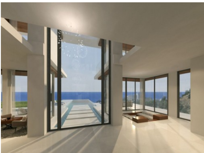
Zona de entrada acogedora