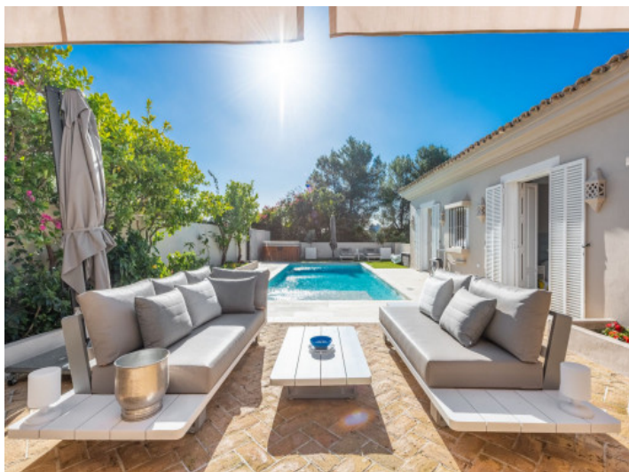
Fantástico espacio exterior