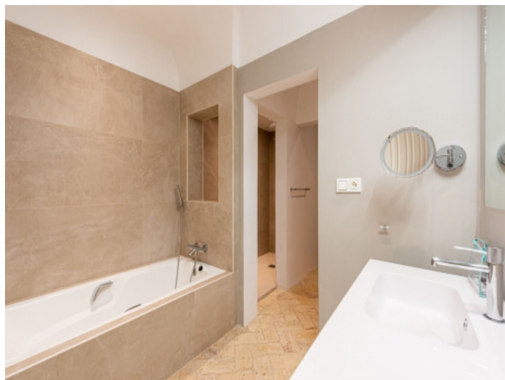
Uno de 5 baños