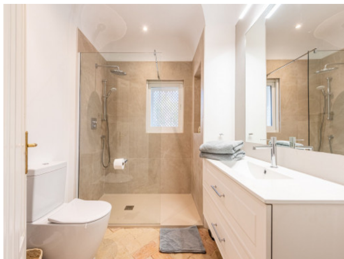
Uno de 5 baños

Toda la información como mejor se puede saber, salvo por error durante el periodo de venta. Sirva este documento como un informe previo, las bases legales solo serán válidas a través de un contrato de compra acordado ante Notario.