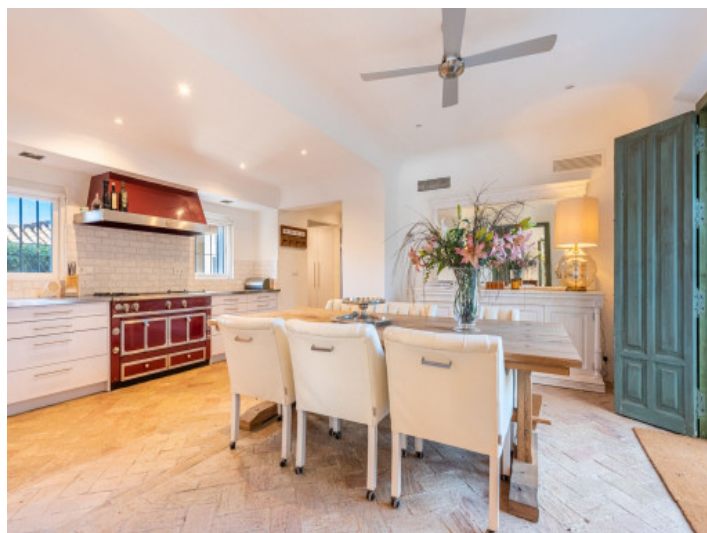
Cocina abierta con zona de comedor

Toda la información como mejor se puede saber, salvo por error durante el periodo de venta. Sirva este documento como un informe previo, las bases legales solo serán válidas a través de un contrato de compra acordado ante Notario.