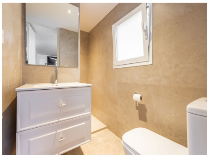
Uno de 5 baños