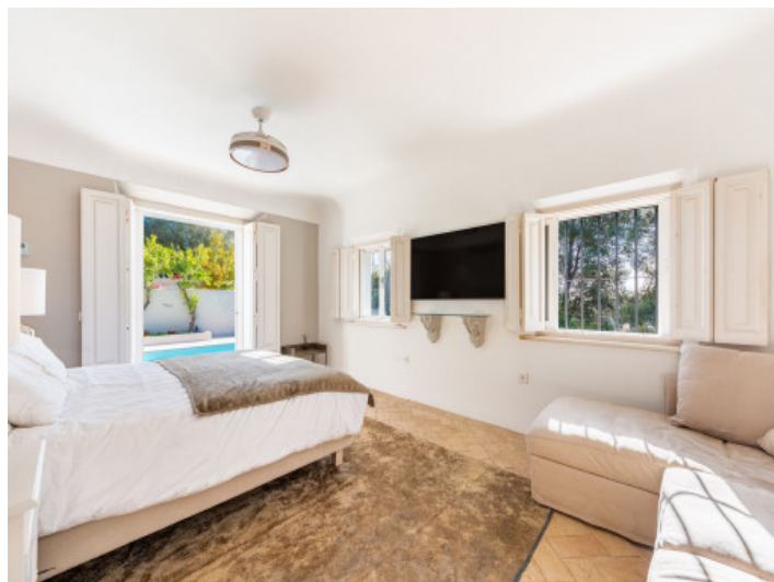
One of 4 bedrooms