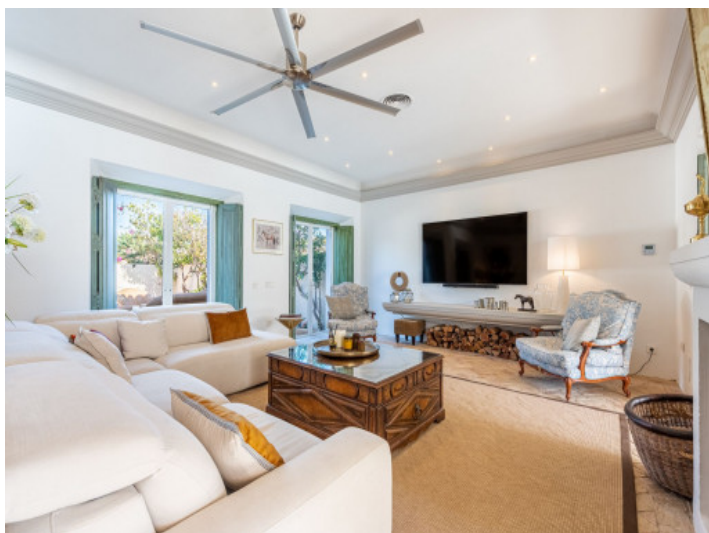
Sala de estar con salida a 2 terrazas