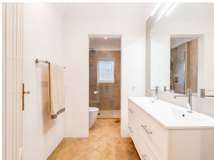
Uno de 5 baños