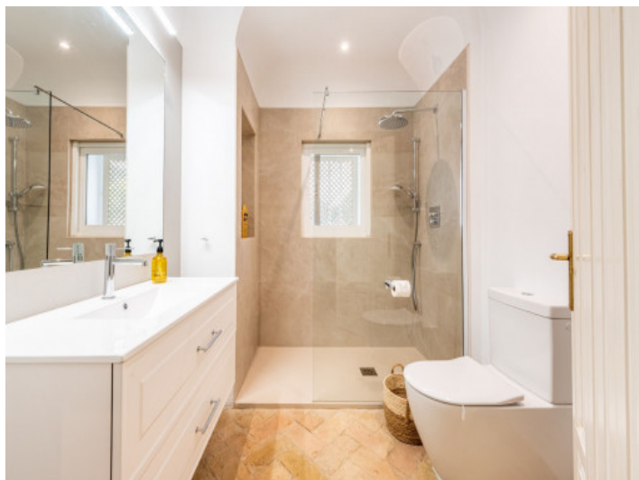
Uno de 5 baños