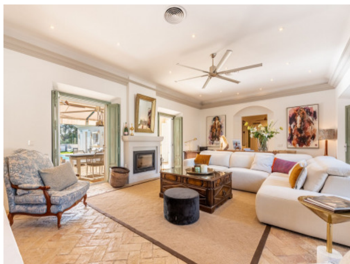
Elegante sala de estar