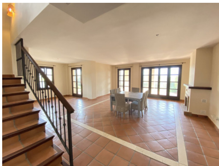
Salón-comedor con chimenea