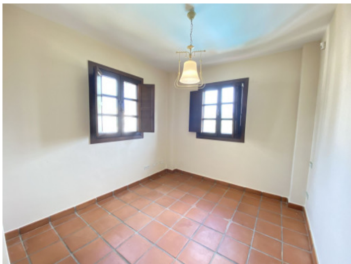
Uno de 3 dormitorios