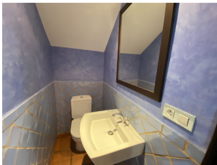
Uno de 2 baños