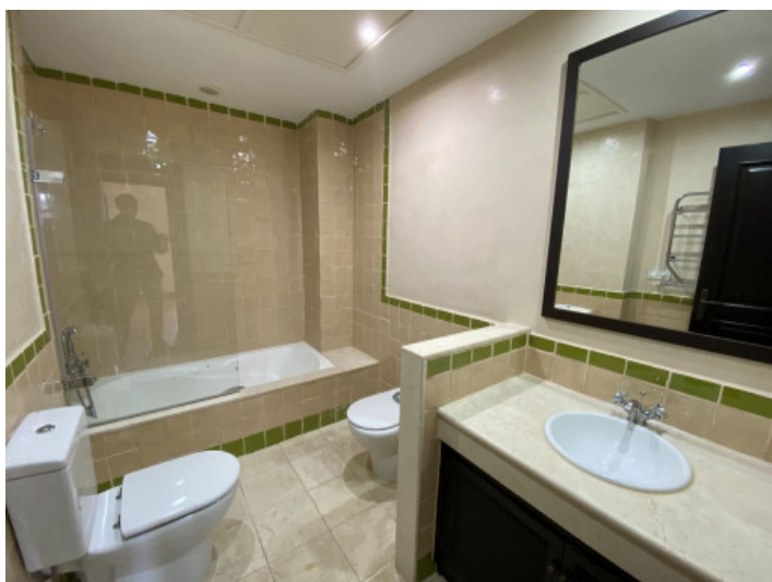
Uno de 2 baños