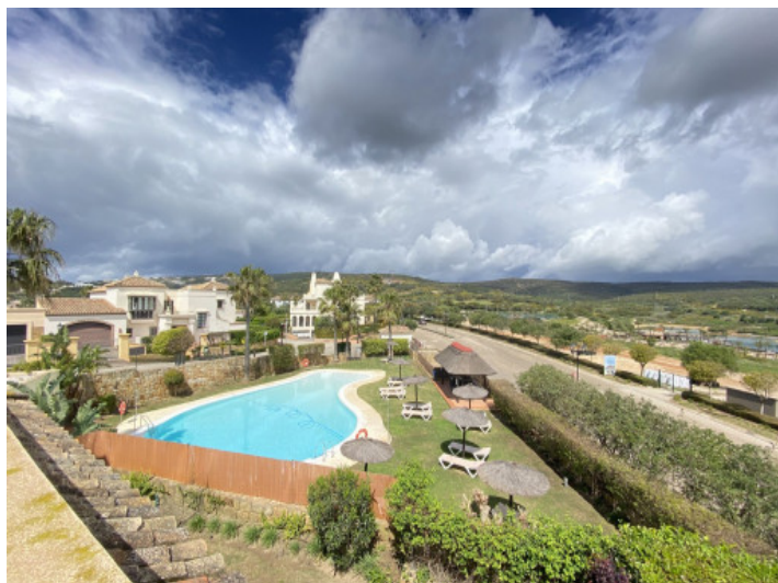
Zona de piscina