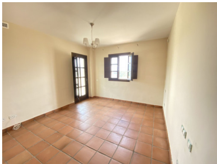
Uno de 3 dormitorios