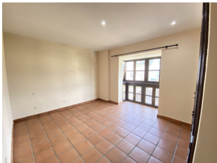
Uno de 3 dormitorios

Toda la información como mejor se puede saber, salvo por error durante el periodo de venta. Sirva este documento como un informe previo, las bases legales solo serán validas a traves de un contrato de compra acordado ante Notario.