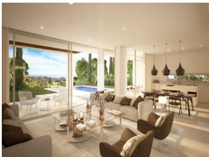
Salón-comedor inundado por luz natural