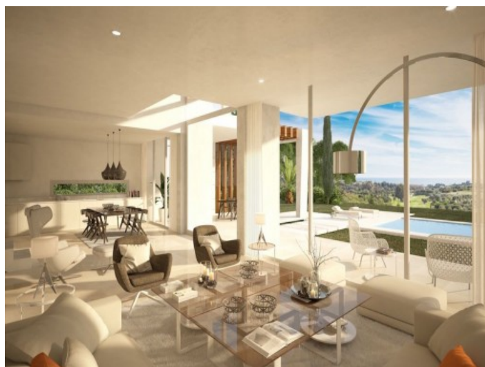
Vista alternativa de la sala de estar con vistas a la piscina