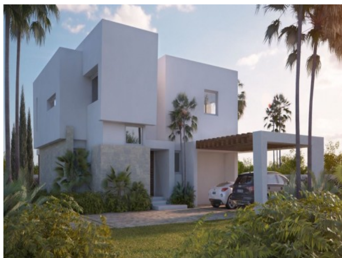
Zona de entrada acogedora con cochera

Toda la información como mejor se puede saber, salvo por error durante el periodo de venta. Sirva este documento como un informe previo, las bases legales solo serán válidas a través de un contrato de compra acordado ante Notario.