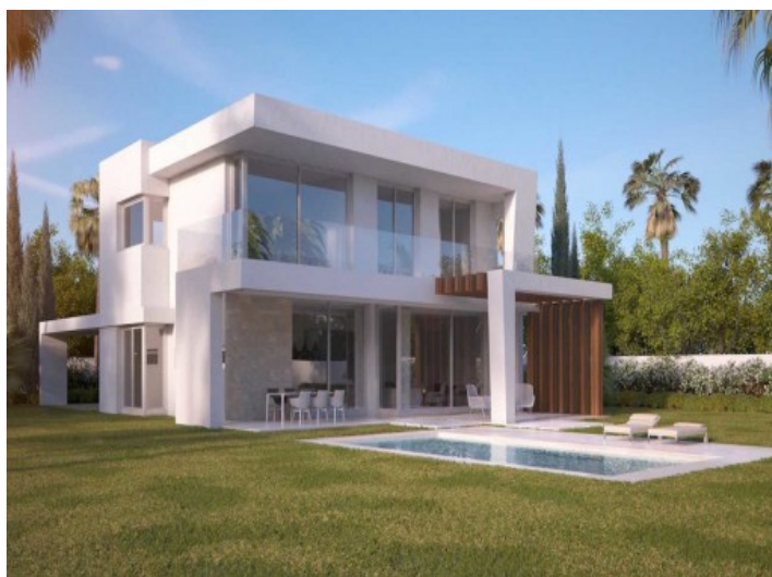
Zona exterior bien cuidada con piscina