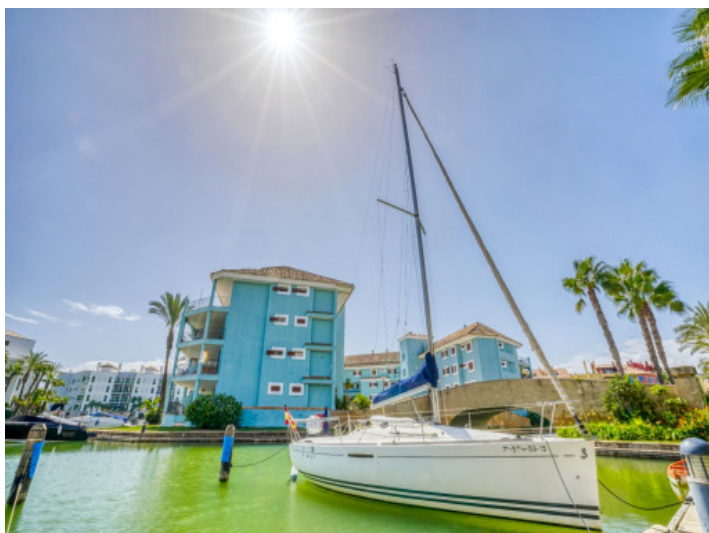
Cerca de la playa